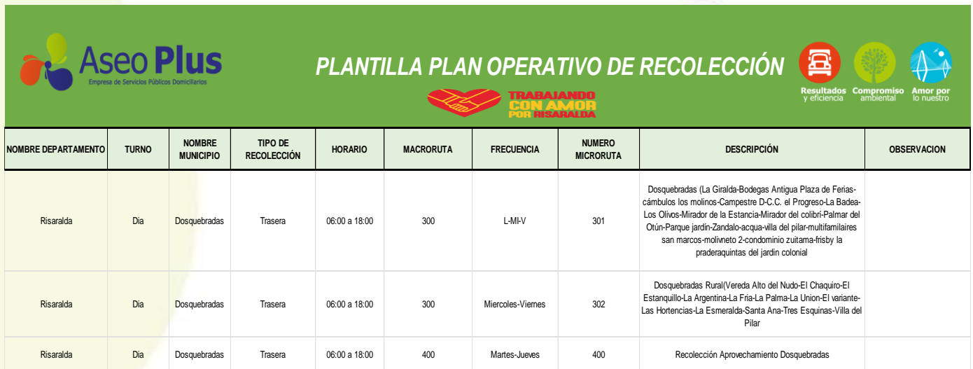
Tabla 7. Microrutas de recolección y transporte.