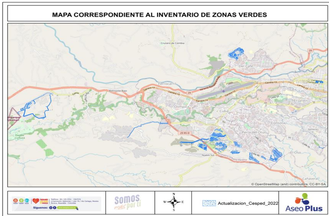
Ilustración 3. Mapa de Zonas de corte de césped