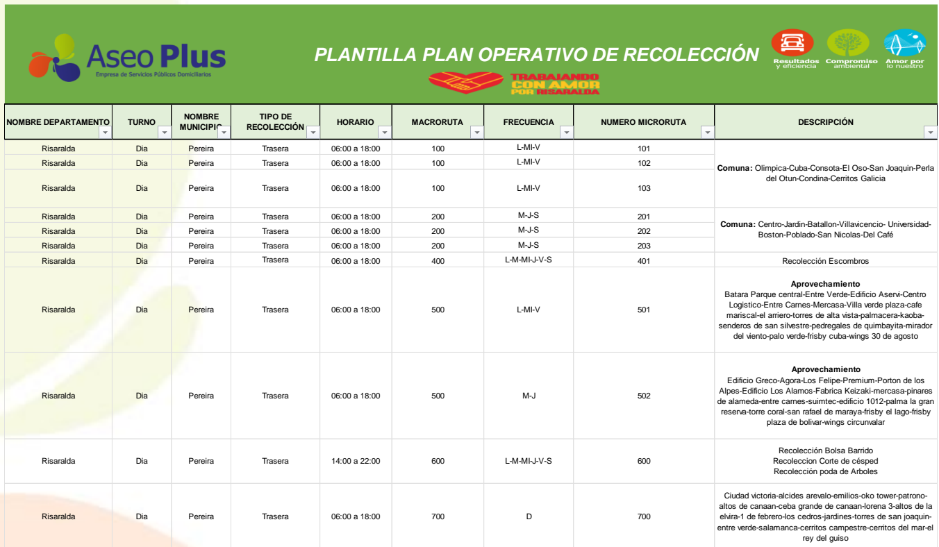
Tabla 2. Recolección y Transporte de residuos