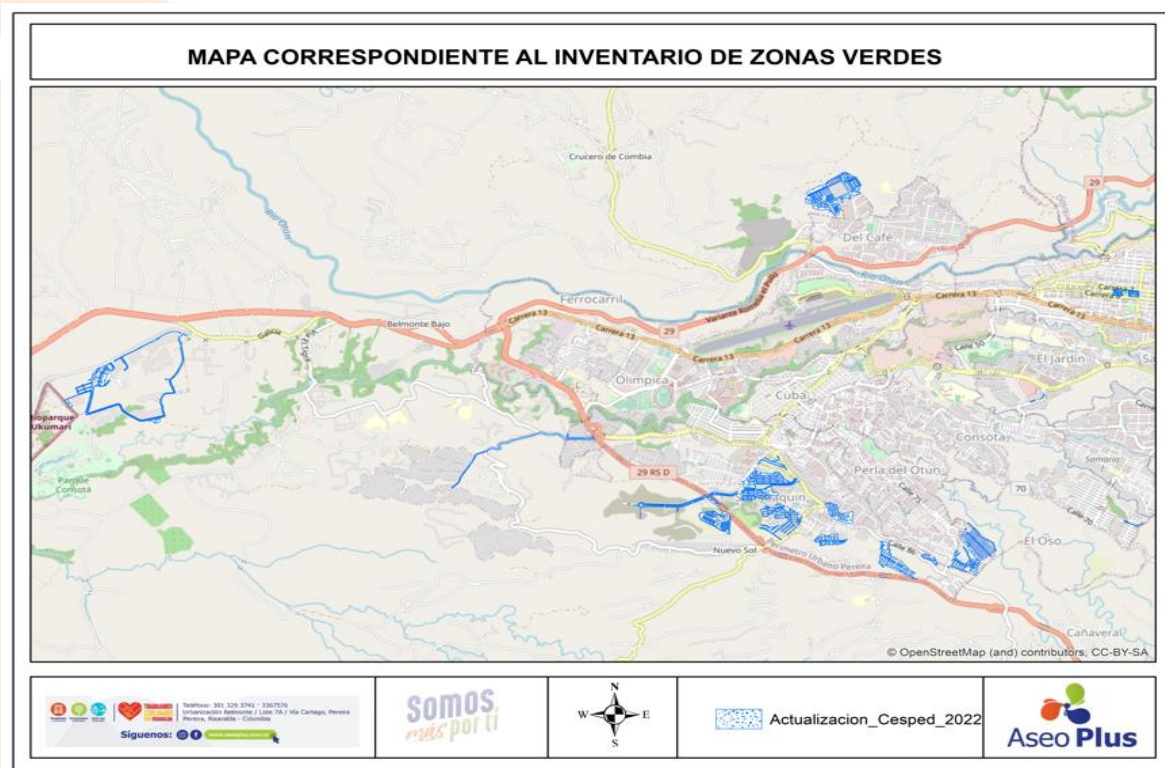
Ilustración 3. Mapa de Zonas de corte de césped

✓ Acuerdo de corte de césped en vías y áreas públicas.