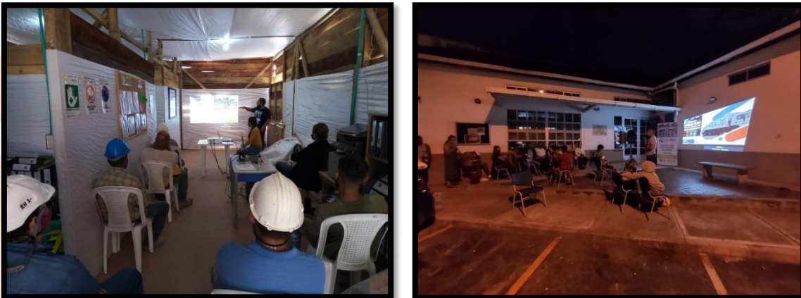
Ilustración 4. Sensibilización para el manejo adecuado de residuos sólidos

Actualmente, la empresa no opera la actividad de aprovechamiento; sin embargo, se promueve la separación en la fuente mediante, campañas de sensibilización y capacitación a los usuarios sobre manejo integral de residuos sólidos y presentación de los mismos para la recolección.