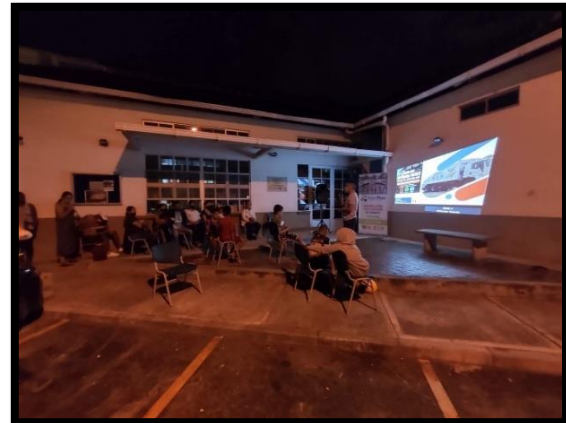
Ilustración 2. Sensibilización para el manejo adecuado de residuos sólidos