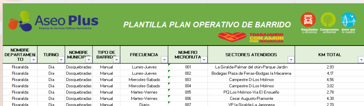
Tabla 11. Microrutas de barrido y limpieza de vías y áreas públicas

A continuación, se presentan los mapas de macros y micro rutas de barrido: