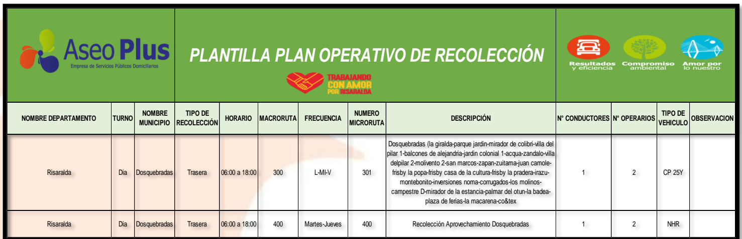
Tabla 7. Microrutas de recolección y transporte.